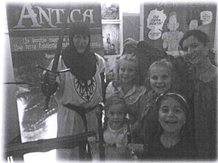
Gli attori di Àntica insieme ai bambini