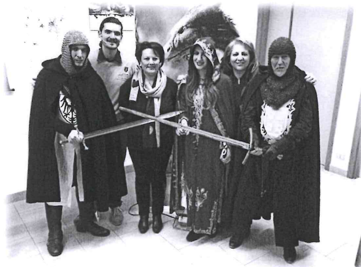
Àntica insieme al preside dell'Istituto Comprensivo Manzoni di Lamezia Terme

Invitiamo pertanto tutti i presidi, i dirigenti scolastici e i professori più intraprendenti a contattarci. I professori che accetteranno di essere referenti del progetto avranno in omaggio la riproduzione di una spada vera.