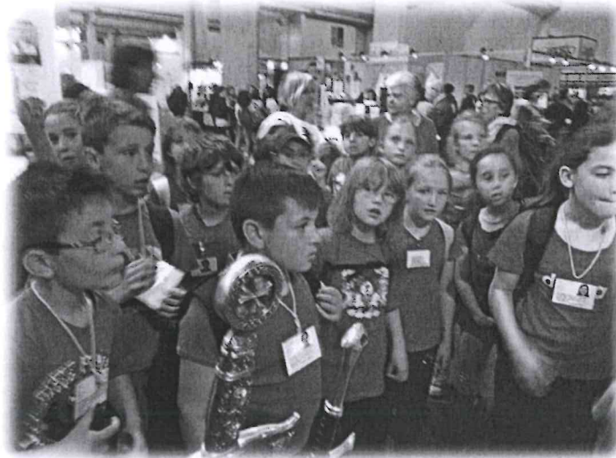
Àntica al salone internazionale del libro di Torino